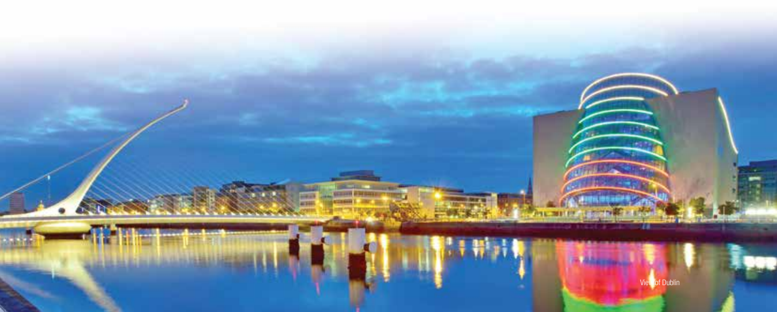
View of Dublin

Nuestro programa resume todo lo que Irlanda tiene para ofrecer y los estudiantes se van con mejores habilidades lingüísticas, recuerdos fantásticos y nuevas amistades para toda la vida.