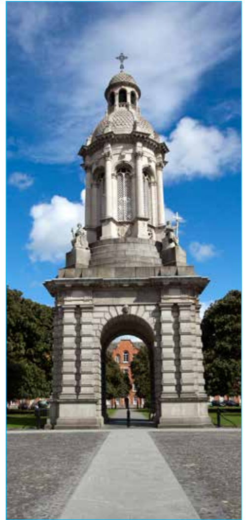
Trinity College, Dublin

Hay actividades dentro y fuera del sitio casi todas las tardes y noches. Programamos una variedad de opciones diferentes para que haya algo para todos: deportes, búsqueda del tesoro, desfile de moda, discoteca, noche de concursos, etc., así como visitas culturales locales. En las excursiones a lugares de interés, los monitores entregan información a los estudiantes y a veces ¡una tarea para competir por un premio!